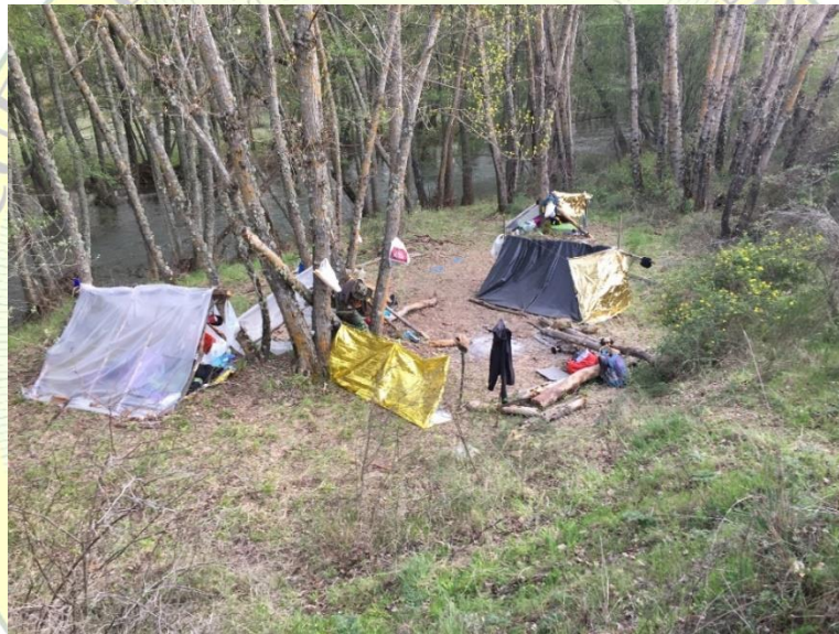
Lugar de acampada con el Jarama al fondo

20:00 h Cena. Taller de astronomía de posición.