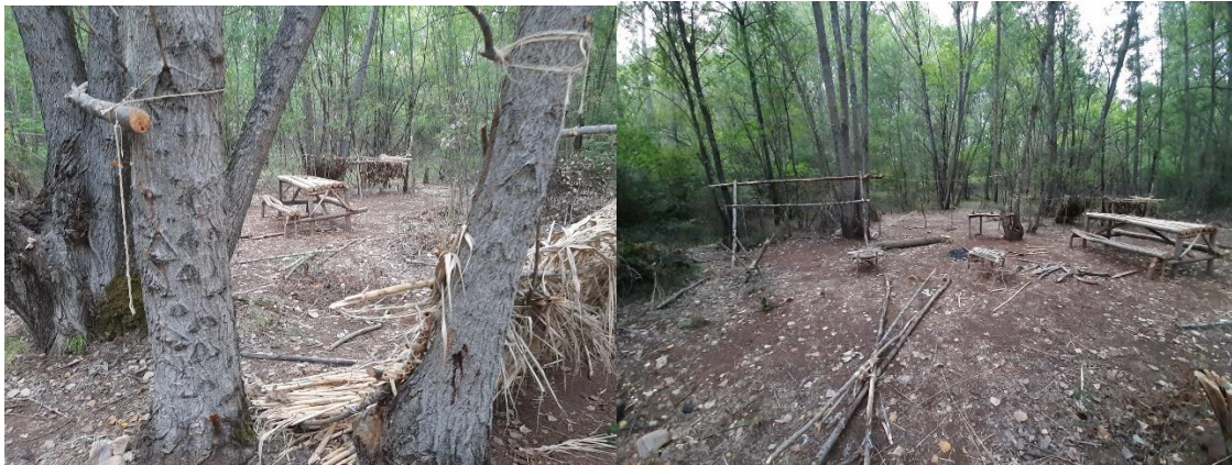
Uno de los lugares de vivac en verano

22:00 h Cena. Taller de astronomía de posición.